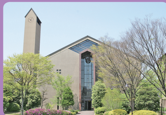
駅改札を出て直進。徒歩約3分。 (改札は1カ所のみです。)

BUS ROUTE 大阪南部にお住まいの方は、南海バス南港線もご利用になれます。