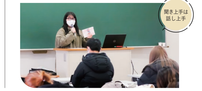
聞き上手は話し上手

「聞き上手は話し上手」というように「聞く力」は「伝える力」の基本ともなります。また、聞くことによって自分中心にものごとを考えてしまう私たちに、他者を理解していくことの大切さを再認識させてくれます。これからもたくさんの本と出合って、自らの思考の世界を広げていってほしいです。