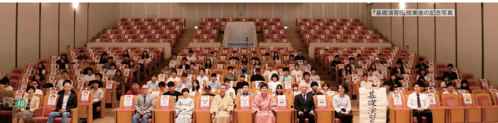
『基礎演習B』授業後の記念写真