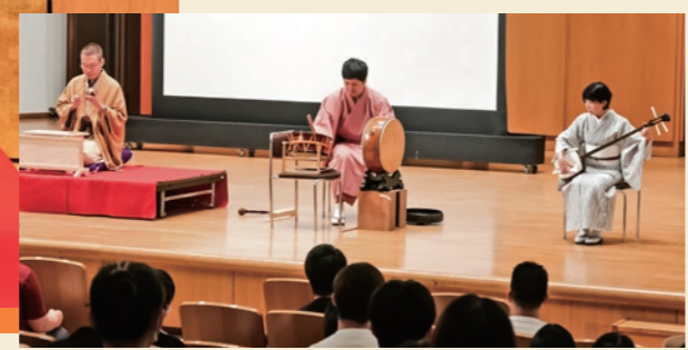
『基礎演習B』での落語実演

相愛寄席が10月16日、相愛大学南港キャンパスで開催されました。人文学部の公開授業『大阪文化特殊講義—日本の宗教と芸能—』の一環として行われる相愛寄席は、今年