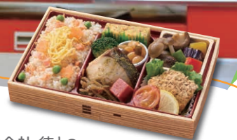
株式会社 徳との お弁当開発プロジェクト お弁当名:低糖質弁当カラダニイネ! 受賞:ファベックス惣菜・べんとう グランプリ2023にて金賞