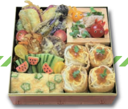
近畿農政局 学生おべんとうコンクール2022 お弁当名:夏の風物詩 夕涼み弁当 受賞:団体の部 グランプリ