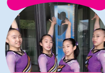
体操天皇杯 第76回 全日本体操個人総合選手権