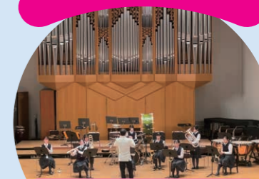
第72回関西吹奏楽コンクール