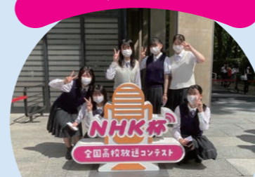
第39回全国中学校放送コンテスト