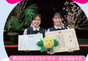
第2回高校生花生けバトル 全国選抜大会