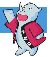
学研災キャラクター サイちゃん

拝啓 時下益々ご清祥のこととお慶び申し上げます。この度、お子様の合格を心よりお祝い申し上げます。