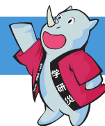
学研災キャラクター サイちゃん

拝啓 時下益々ご清祥のこととお慶び申し上げます。この度、お子様の合格を心よりお祝い申し上げます。